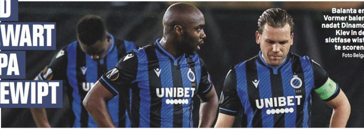
Balanta en Vormer balen nadat Dinamo Kiev in de sloffase wist te scoren.